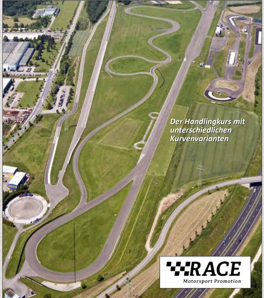
Der Handlingkurs mit unterschiedlichen Kurvenvarianten