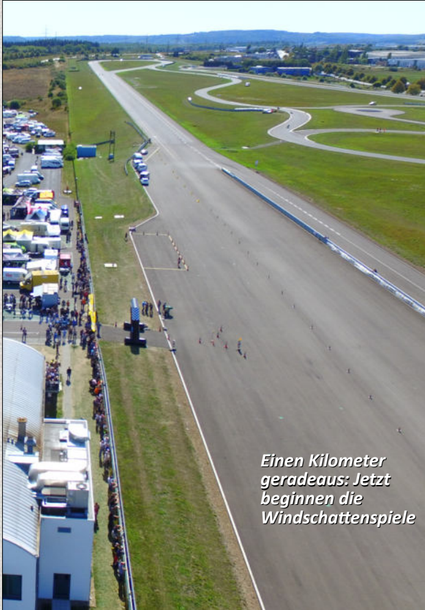
Einen Kilometer geradeaus: Jetzt beginnen die Windschattenspiele

Als Teststrecke gebaut, finden unter der Woche zahlreiche Versuche der Reifen- und Automobil-Industrie statt. Als Rennstrecke in Circuit of Luxembourg umgetauft, wird der knapp 3 Kilometer lange Kurs am langen Pfingst-Wochenende zur Rennstrecke. Bekannte Rennserien, wie IDM und Pro Superbike, führen ebenfalls schon dort. In dieser Saison sind wieder Gastklassen Klassen am Start. Die Strecke bietet den Fahrern jede Menge Abwechslung, wie kaum eine andere Strecke. Einerseits benötigt man für die 1 Kilometer lange Gerade Leistung mit Windschattenspielen. Andererseits fordert der Streckenteil des Handlingskurses mit verschiedenartigen Kurven vom Fahrer alles ab. Freut euch auf die Abwechslung.